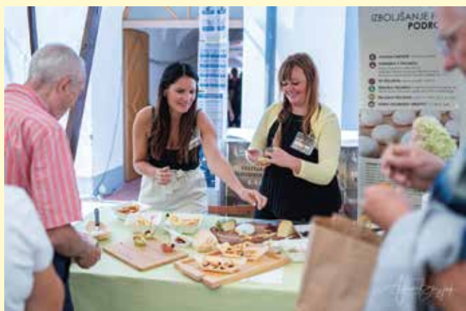
Izvedba 32. festivala Dobrote slovenskih kmetij v septembru ob predhodni izvedbi senzoričnih ocenjevanj.