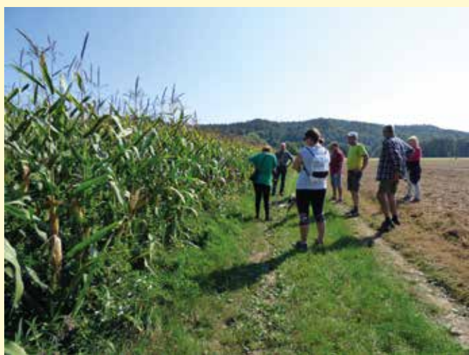
Na poskusnih poljih smo imeli več delavnic v katerih smo prikazali učinke različnih načinov zatiranja plevelov v žitih in koruzi.