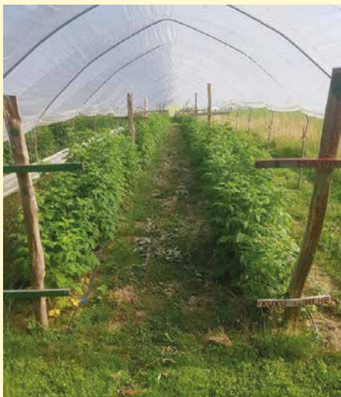
Pridelava malin v visokih tunelih se na našem območju širi