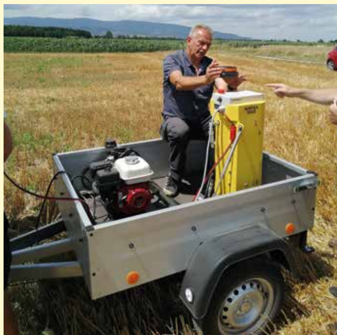
Posodobitev laboratorijske opremljenosti za izvajanje analitike stanja humusa v tleh od vzorčenja in analitike.