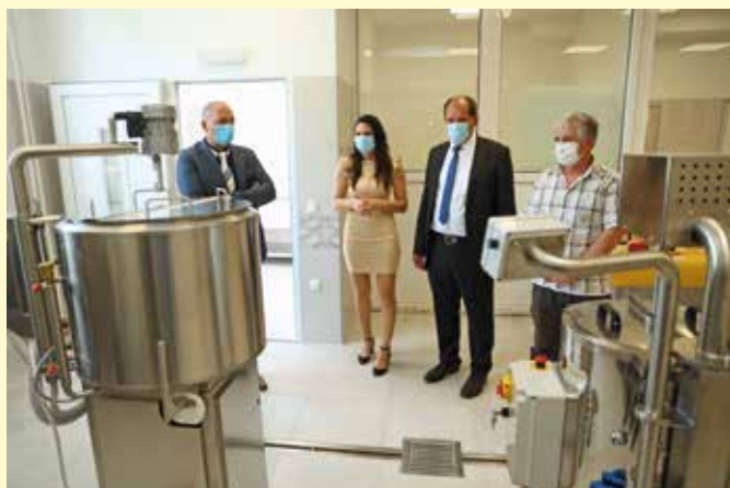
Odprtje novih prostorov učilnice in opreme za izvajanje izobraževanj iz predelave mleka, vrtnin in poljščin v okviru dneva zavoda.