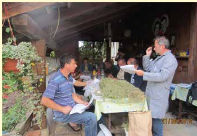
Trenutna tržna niša je prodaja senenega mleka in mesa, zato so prikazi pridelave kakovostnega sena zelo pomembni za rejo živine.