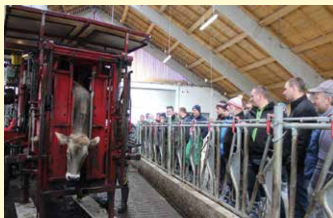
Obiski razstav in spremljanje rejskega dela v tujini so pomembni za prenos znanja