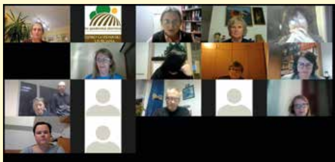
Posvet o jagodah, še vedno preko spleta