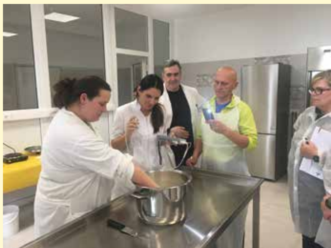
Tečaj predelave mleka v novi učni davnici