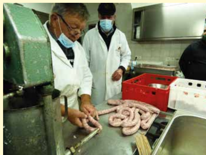
Tečaj predelave mesa v suhomesnate izdelke

Kontakt svetovalcev: https://lj.kgzs.si/svetovanje