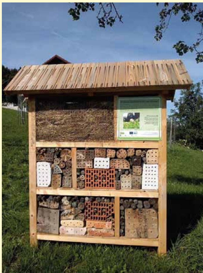
Zaključek projekta LIFE to GRASSLANDS za ohranitev suhih travišč in travniških visokodebelnih sadovnjakov.