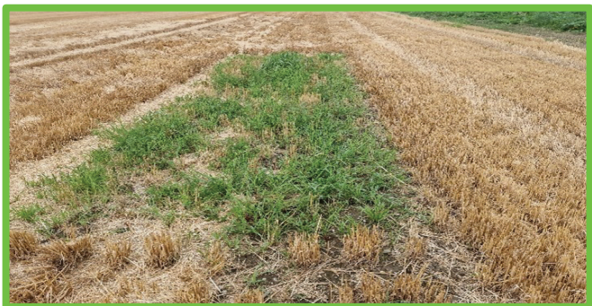
Primer zaplate, posneto po spravilu žita