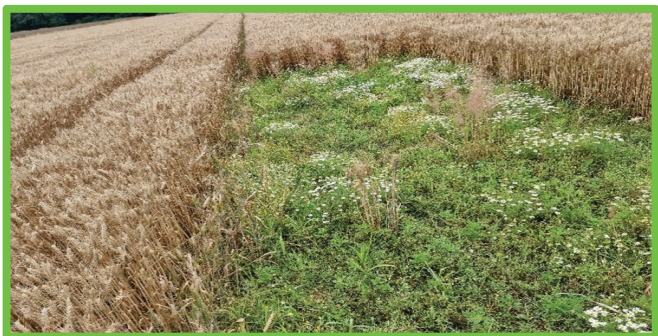
Primer zaplate neposejanih tal v žitu