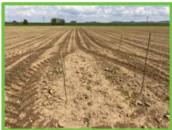
Primer varovanega gnezda, ki je bilo obvoženo med delovnimi opravili