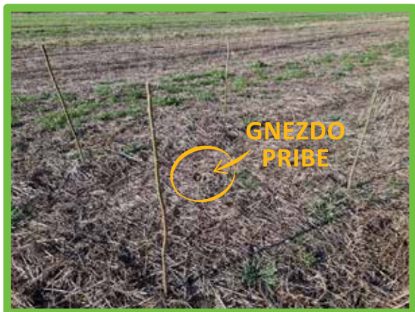
Primer označitve gnezda s štirimi količki