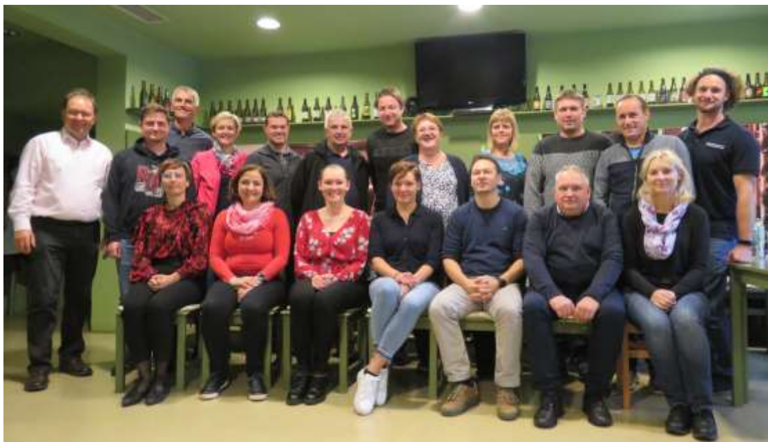
Zbor projektne skupine EIP EKOHMELJ po pregledu polletnega dela.