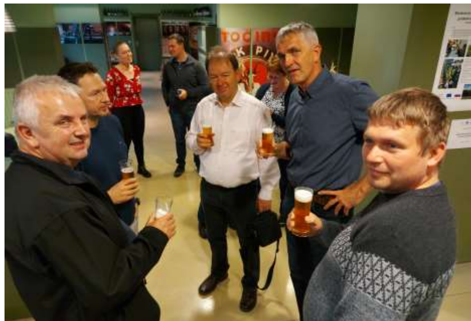
Poizkušnja piva slovenskih sort hmelja z zaščiteno geografsko označbo Styrian hops.