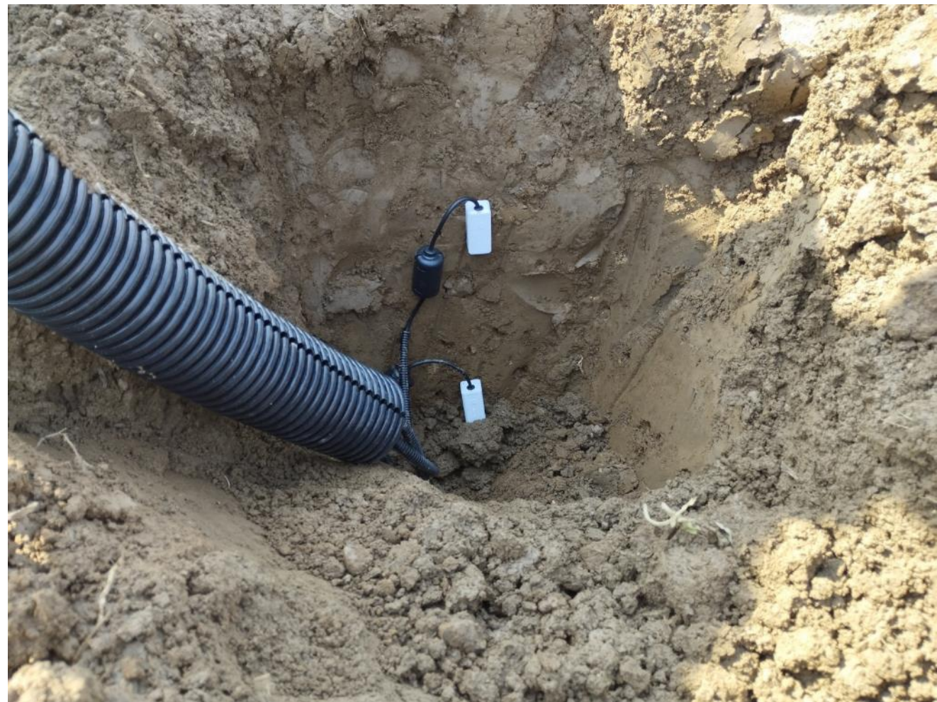
Vlažnost tal (%) 01/07/2024 - 31/08/2024